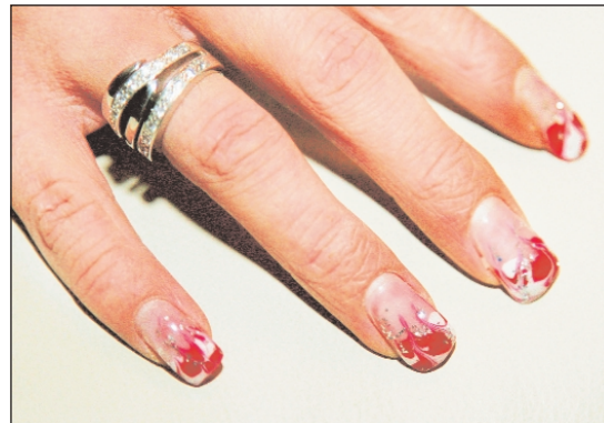
Kunst an der Hand: Die verzierten Fingernägel eines Ortenauer Modells.