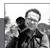
Eine Fotoreportage von Ulrich Marx