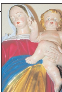
Segnende Hände, Hl.-Kreuz-Kirche.