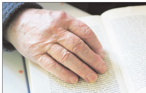
Gepägt: Die Hände eines 97-jährigen Offenburgers.